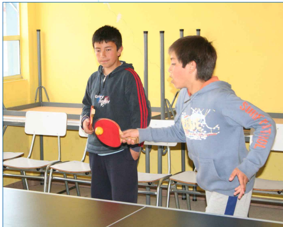
Tenis de mesa dama y varones, con una cobertura de 18 alumnos.