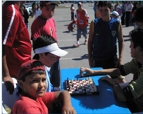
Ajedrez damas y varones, con una cobertura de 8 alumnos.