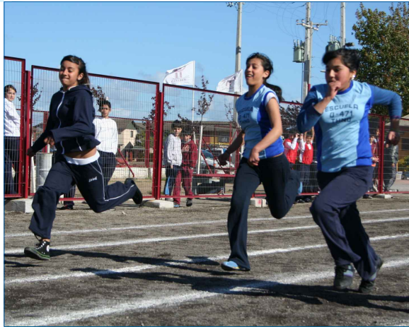
Atletismo damas y varones, con una cobertura de 20 alumnos.